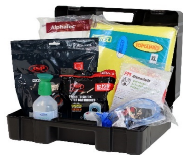
Pflanzenschutz-Set nach BBA