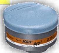
Ersatzfilter f. Scotts Profile 2