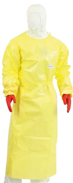
Ärmelschürze nach BVL Richtlinie