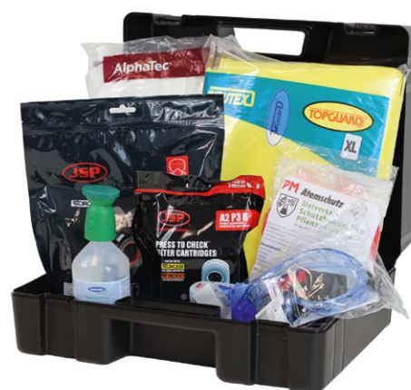
Pflanzenschutzset nach BVL Richtlinie im Koffer